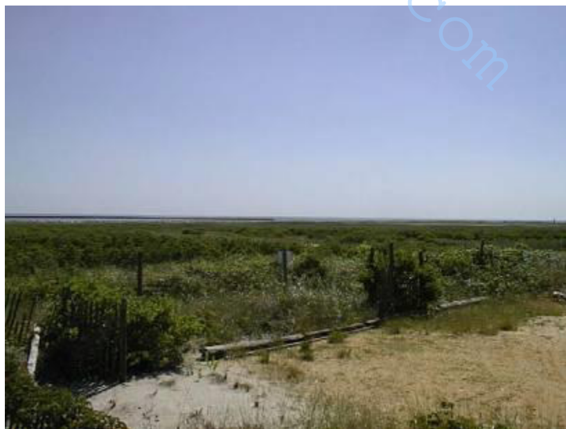
Рис. 12 – открытая земля между площадкой в Нью-Джерси и Океаном