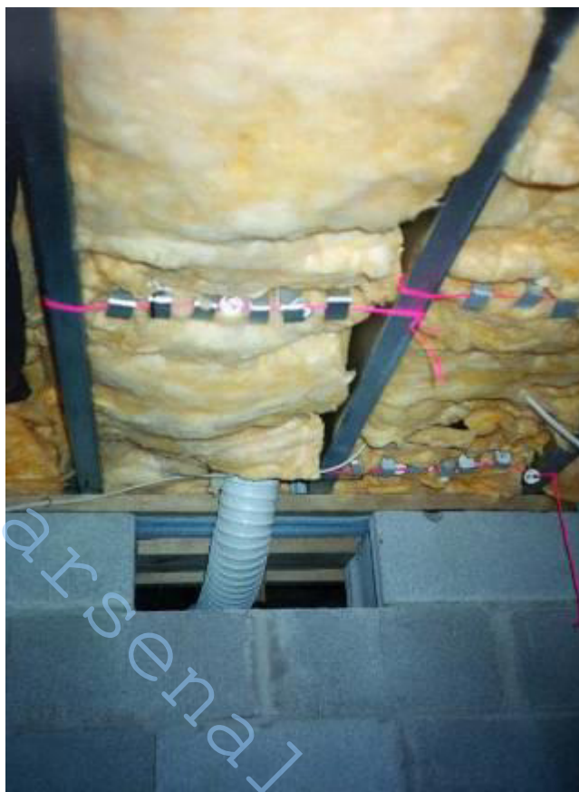
Рис 5 – Образцы подвала, заделанные в изоляцию пола