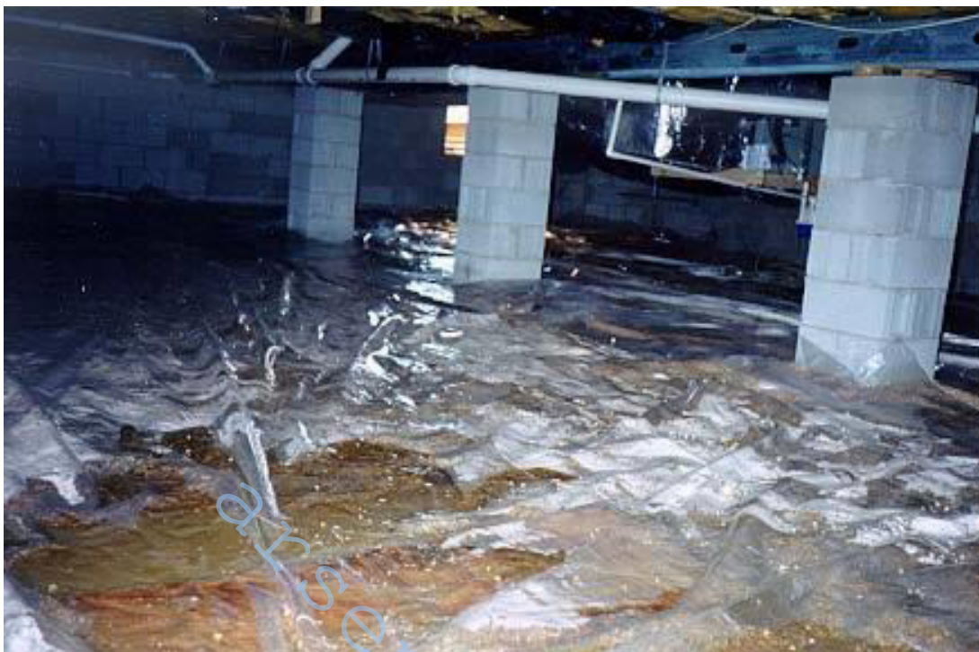
Рис 7 – Вода (передний план) в подвале, в Леонардтаун

Образцы были установлены под открытым первым этажом, что показывает ужасные условия окружающей среды. Этаж несомненно подвергается брызгам реки и состоит из деревянного каркаса. Образец под этажом будет показывать технические данные в экстремально суровых условиях окружающей среды. Образец состоит из оцинкованных, гальванических, алюмоцинкованных и без покрытия образцов свай.