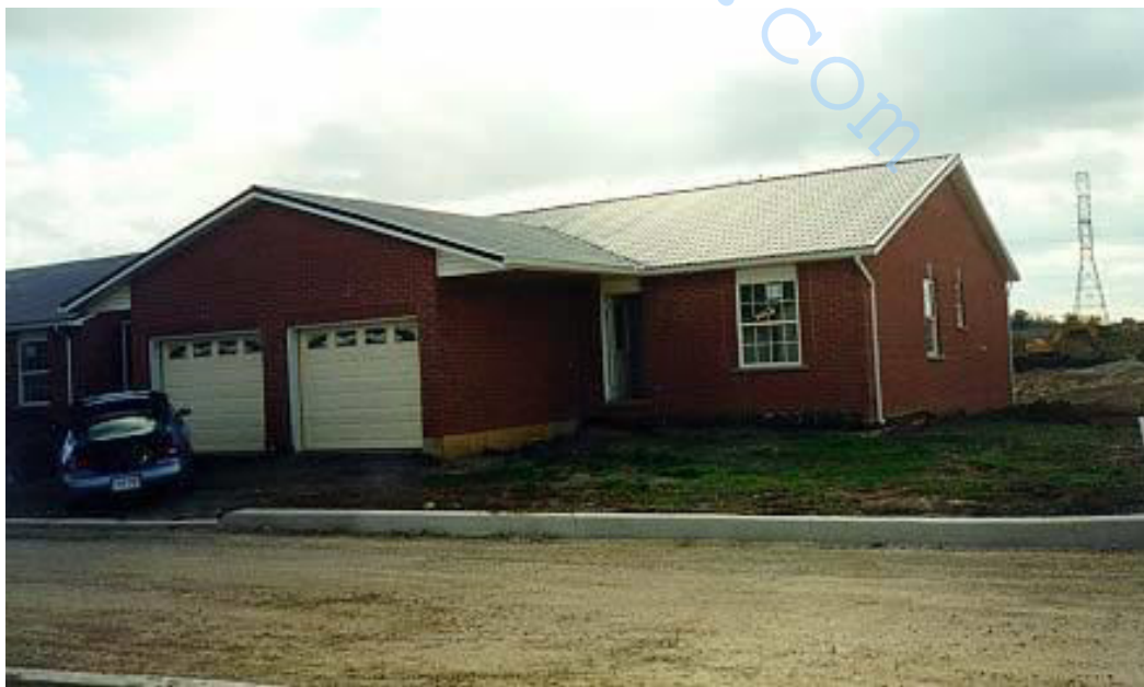
Рис. 8 – Хамильтон, Онтарио, Тестовая площадка (вид спереди)

Двойная конструкция была оснащена образцами коррозии и аппаратурой контроля зимой 1997. Дом имеет кирпичную облицовку и расположен в промышленной зоне. Образцы и датчики слежения были установлены на мансарде и внешней стене фундамента.