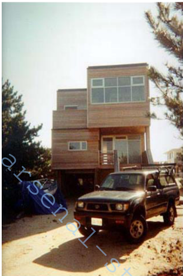
Рис. 11 – Площадка в Нью-Джерси