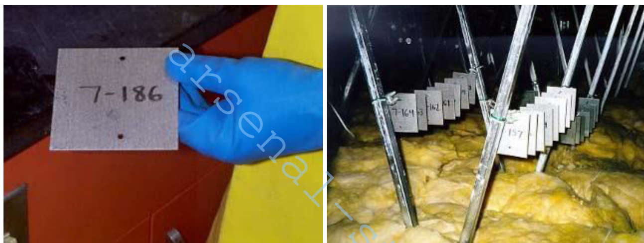
Рис. 1 – Образцы пластин

Образцы коррозии состоят из оцинкованного, алюмоцинкованного и гальванических покрытий на плоских пластинах размером 10 см x 10 см (3.94 дюйм x 3.94 дюйм) и 1-дюймового (25.4 мм) (номинальный) элемента С-образной сваи. Плоские плиты позволяют более точно определить область образца, и поэтому лучше измерить толщину покрытия и уменьшение массы после подвергания внешнему воздействию (Рис. 1). С-образные образцы были установлены для исследования поведения коррозии на концах и изгибах сваи. Стороны и все концы образцов плит и образцов свай подвержены воздействию окружающей среды, которые совместимы с методом, используемым в параллельном исследовании во Франции. Спецификации толщины покрытия образцов указаны в Таблице 1.