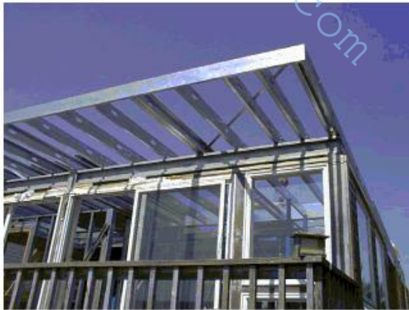
Figure 14 –Balcony for the New Jersey Site