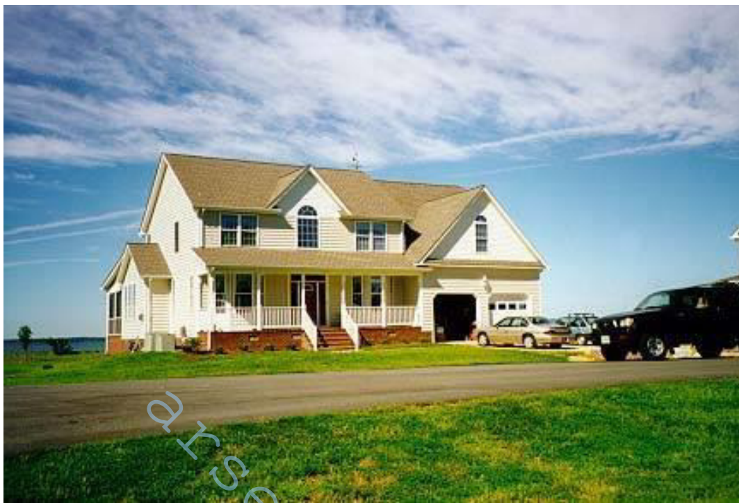
Рис. 4 – Площадка в Leonardtown, Maryland, на реке Lower Potomac

Мансарда содержала три типа покрытия на плите и свае. Эти образцы были повдешены на мансарде с виниловой веревкой или шнурком. Второй набор образцов также был заделан в целлюлозную изоляцию мансарды. Назначением второго набора было изучение взаимодействия между оцинкованным покрытием и целлюлозной изоляцией.