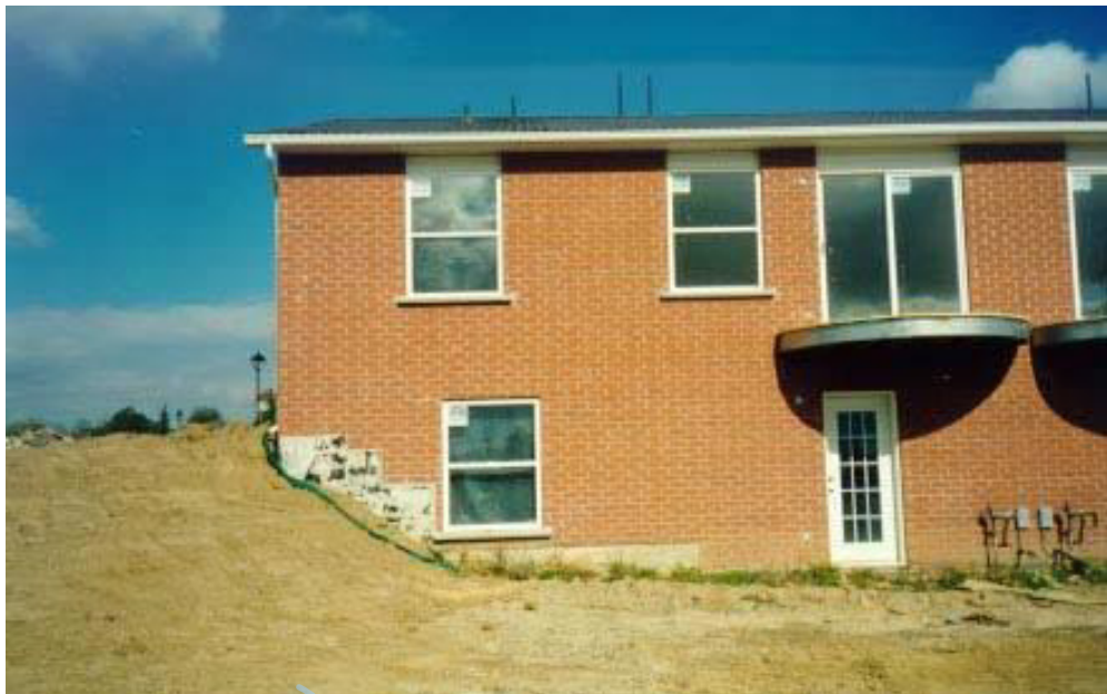
Рис. 9 – Хамильтон, Онтарио, Тестовая площадка (вид сзади)

Образцы мансарды были подвешены в воздухе и состояли из оцинкованного, гальванического и алюмоцинкованного покрытий. Терморезисторы были прикреплены к одной пластине каждого покрытия для записи температур поверхностей трех типов металла. Температура окружающей среды и относительная влажность также были измерены. Время датчика влаги, который был установлен на оцинкованный образец, записал процент времени наличия тонкого слоя жидкости.