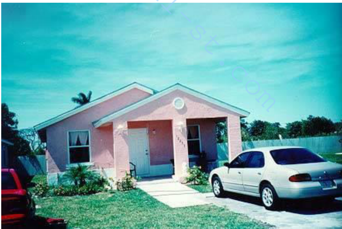
Рис. 2 - Майями, Флорида, Площадка коррозии

Группа впадин стены имеет западную ориентацию и содержит образцы, которые были доступны для съема через доступ к панелям. Образцы состоят из оцинкованных, гальванических и алюмоцинкованных кусочков плит. Образцы были заделаны в стекловолокнистую изоляцию в полости стены.