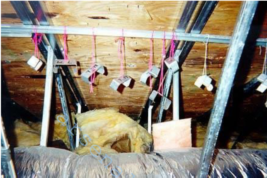
Рис. 3 – образцы мансард на площадке в Майми, Флорида