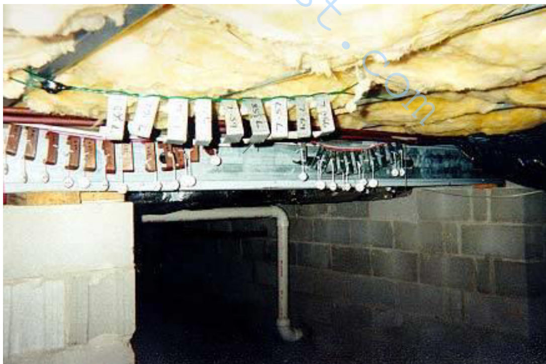
Рис 6 – образец сваи в подвале на площадке в Леонардтаун