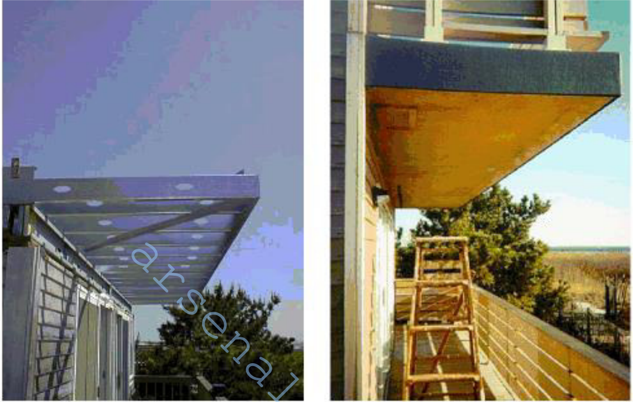
Figure 13 –New Jersey Site Under Construction