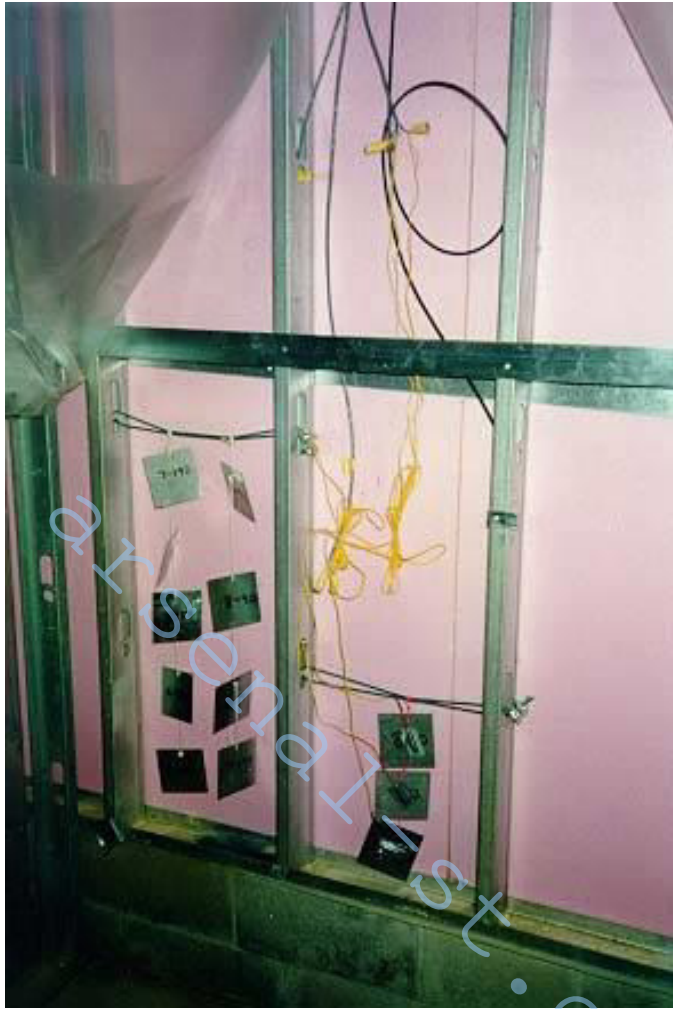
Рис. 10 – Образцы впадины стены и датчики на площадке в Хамильтоне, Онтарио